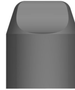
BUCKET SHAPED INSERTS